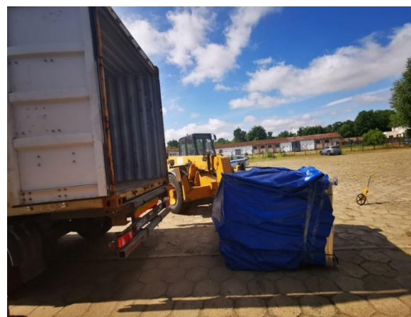
miejsce wypadku – widok od strony magazynu

Podczas kontroli w firmie ogólnobudowlanej, zakończonej 23 października 2025 r. na terenie OIP Zielona Góra stwierdzono nielegalne zatrudnianie cudzoziemca ob. Maroko . W celu ustalenia legalności zatrudnienia cudzoziemca nawiązano współpracę z Lubuskim Urzędem Wojewódzkim, celem ustalenia stanu faktycznego. Po otrzymaniu pisma z LUW w Gorzowie Wlkp., o nielegalnym zatrudnieniu pracownika, powiadomiony został Wojewoda Lubuski oraz