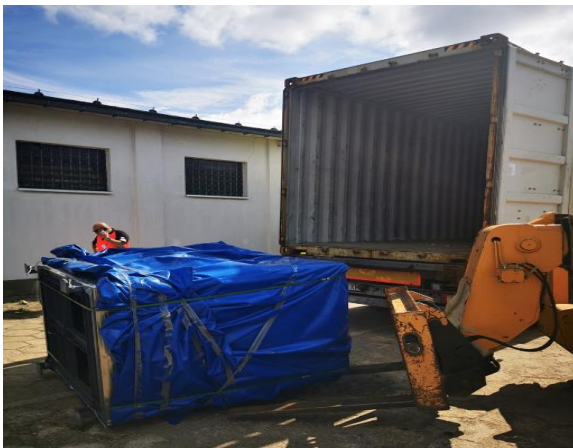
miejsce wypadku – widok od strony placu