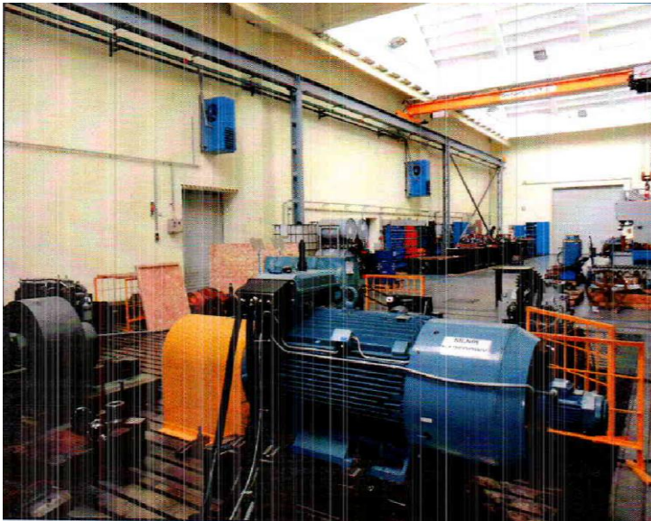
Stacja prób – widok silnika napędzającego i odbierającego wraz z przekładnią